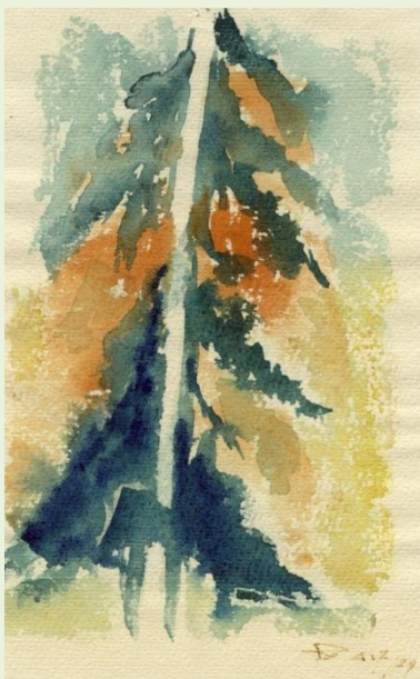
Aquarelle de M. Rollier, ancien membre de la SNF, artiste peintre et ami de la forêt