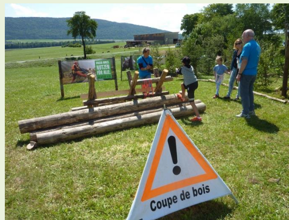
Présence de la SNF à la «Fête la Terre»