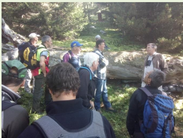
Excursion à Balavaux en 2016