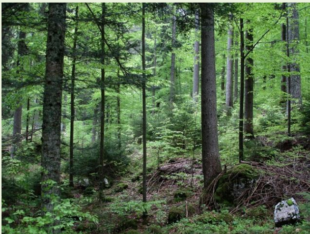
Forêt cantonale du Creux-du-Van

Une société ouverte à tous les amis et professionnels de la forêt et du bois