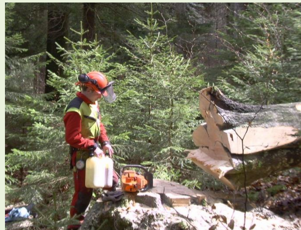
Pour l'entretien des forêts : le forestier-bûcheron