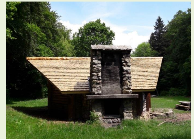
L'abri du Pré Vert (Chambrelieu)