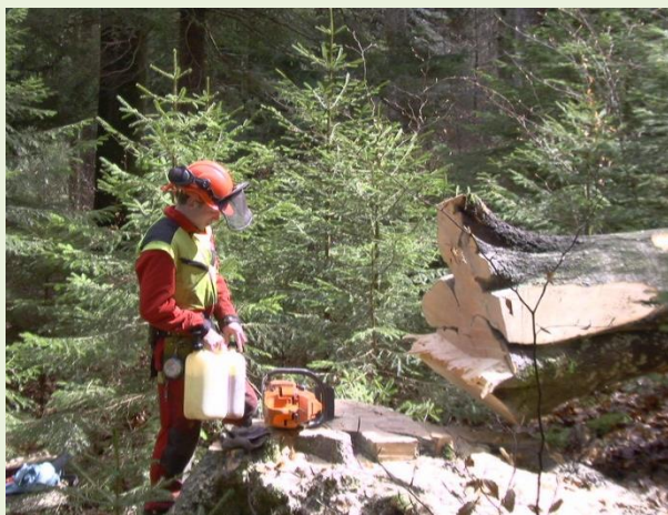
Pour l'entretien des forêts : le forestier-bûcheron