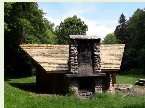
L'abri du Pré Vert (Chambrelieu)