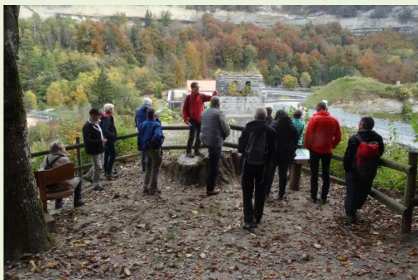
Excursion à Fribourg en 2017

Les membres de la SNF se retrouvent une fois l'an lors de l'assemblée générale agrémentée d'une conférence consacrée à un thème forestier. Ils se retrouvent aussi, dans le terrain, à la course annuelle, proche ou lointaine, ainsi qu'aux diverses manifestations qui s'invitent dans la vie forestière de notre canton.